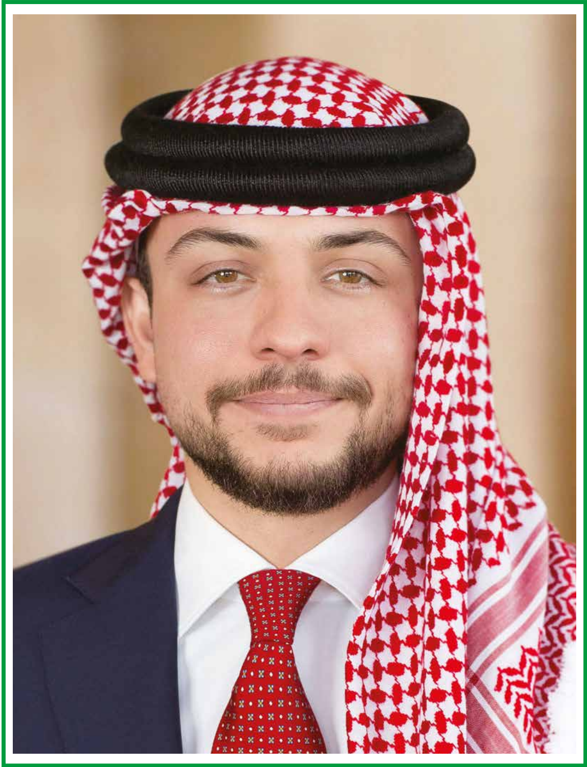
صاحب السمو الملكي الأمير الحسين بن عبدالله الثاني ولي العهد المعظم