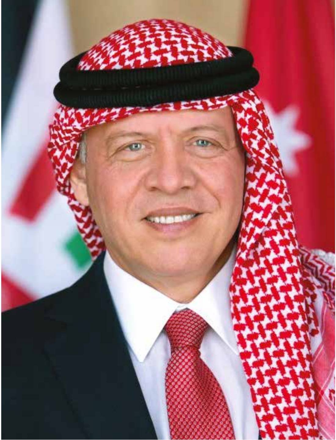
حضرة صاحب الجلالة الهاشمية الملك عبدالله الثاني ابن الحسين المعظم